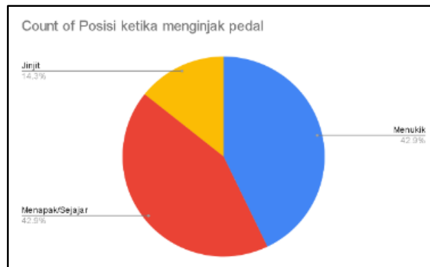
Gambar 2. Posisi ketika menginjak pedal

Dari chart atas terlihat responden paling banyak yaitu dari postur tubuh yang tegap berjumlah 50.0% disusul dengan bungkuk berjumlah 37.5% dan berdiri 12.5%. Beberapa faktor dapat berkaitan dengan nyeri pada pinggang.