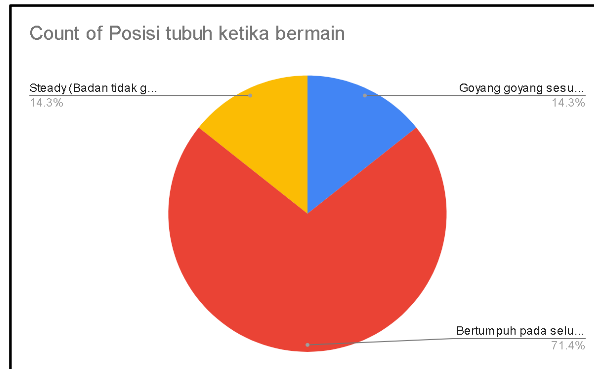
Gambar 4. Posisi tubuh ketika bermain

Dari data chart diatas menunjukkan persentase tubuh ketika bermain drum pada posisi bertumpuh pada seluruh tubuh 71.4%, goyang-goyang sesuai beat berjumlah 14.3% dan steady berjumlah 14.3%.