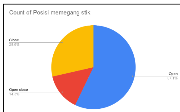
Gambar 3. Posisi memegang stik

Dari data chart diatas menunjukkan persentase kaki ketika menginjak pedal pada posisi menapak/ sejajar berjumlah 42.9%, menapak/ sejajar berjumlah 42.9% dan jinjit berjumlah 14.2%. Ini berdampak juga pada dengan kenyamanan dan tenaga dengan faktor irama musik yang dimainkan.