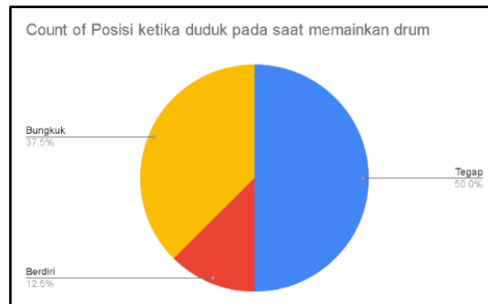
Gambar 1. Posisi ketika duduk pada saat memainkan drum

Dari chart atas terlihat responden paling banyak yaitu dari postur tubuh yang tegap berjumlah 50.0% disusul dengan bungkuk berjumlah 37.5% dan berdiri 12.5%. Beberapa faktor dapat berkaitan dengan nyeri pada pinggang.