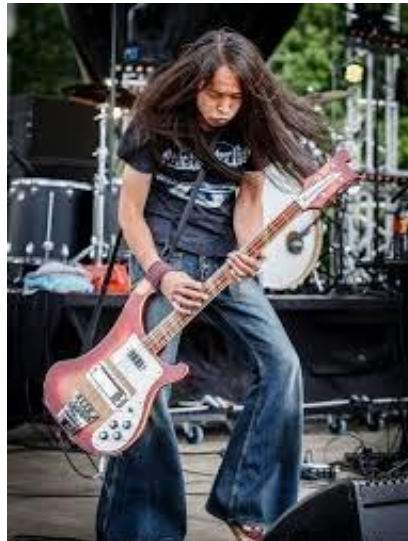
Gambar 11. Potret Postur Pemain Bass

Pada gambar 11 memperlihatkan sosok pria bermain bass menggunakan model rickenbacker 4003 dengan bobot berat 4.1 kg dan posisi alat musiknya sejajar dengan lutut