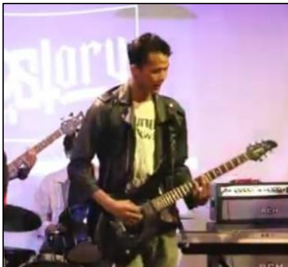
Gambar 10 Potret Pemain Gitar

Pada gambar 10 menunjukkan sosok pemain gitar yang menggunakan gitar model super stratocaster yamaha pasifica rgx121z berwarna hitam memiliki bobot 2.5kg dengan strap (sabuk gitar) berwarna hitam, disitu terlihat posisi strap yang terulur panjang dengan gitar berada diatas pinggang