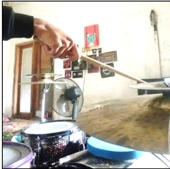
Gambar 9. Posisi Tangan

Pada gambar 9 menunjukkan tangan memukul simbal ride dengan posisi menekuk dan menggunakan gengaman close grip .