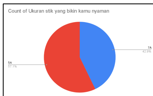
Gambar 5. Ukuran stik

Dari data chart diatas menunjukkan persentase tubuh ketika bermain drum pada posisi bertumpuh pada seluruh tubuh 71.4%, goyang-goyang sesuai beat berjumlah 14.3% dan steady berjumlah 14.3%.