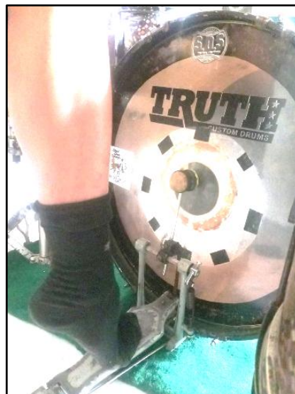
Gambar 8. Posisi Kaki

Pada gambar 8 menunjukkan posisi kaki menukik pada waktu menginjak pedal dengan betis sebagai tumpuannya agar tone yang dihasilkan lebih jelas sehingga power yang dikeluarkan lebih besar.