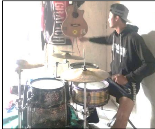
Gambar 7. Postur Tubuh Tegap

Pada gambar 7. menunjukkan posisi seorang pemain drum dengan postur tubuh tegap tinggi dan set up instrumen yang rendah.